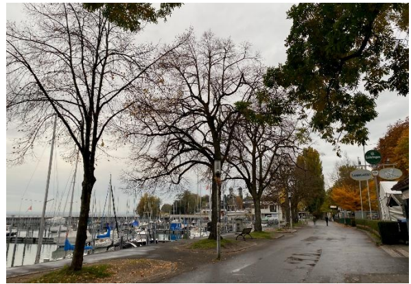
Die Linden an der Promenade sind krank.