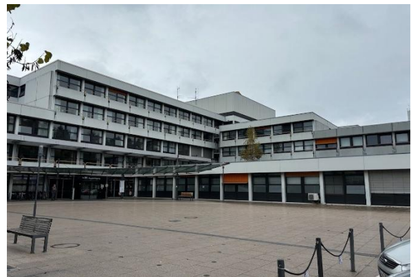
Wir wollen das Häfler Klinikum erhalten.