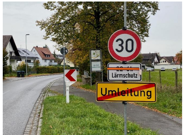
Wie hier in Schnetzenhausen sind die Tempo-30-Zonen ausgeweitet worden und bringen den Anwohner:innen ein ruhigeres Leben.