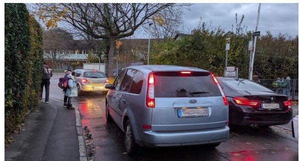
Morgendliches Verkehrschaos vor der Schreienesch-Grundschule

Grundschulkinder sind im Straßenverkehr noch nicht so geübt und zudem so klein, dass sie von Autofahrern häufig übersehen werden. Deshalb müssen ihre Schulwege besonders sicher sein. „Elterntaxis“ bis zum Schultor sind unserer Meinung nach die falsche Lösung. Wir haben deshalb einen Antrag auf die Einrichtung von Schulstraßen gestellt.